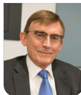
PATRICK CURTAUD 4 e Vice-président en charge de la culture, du patrimoine, du devoir de mémoire et de la coopération internationale